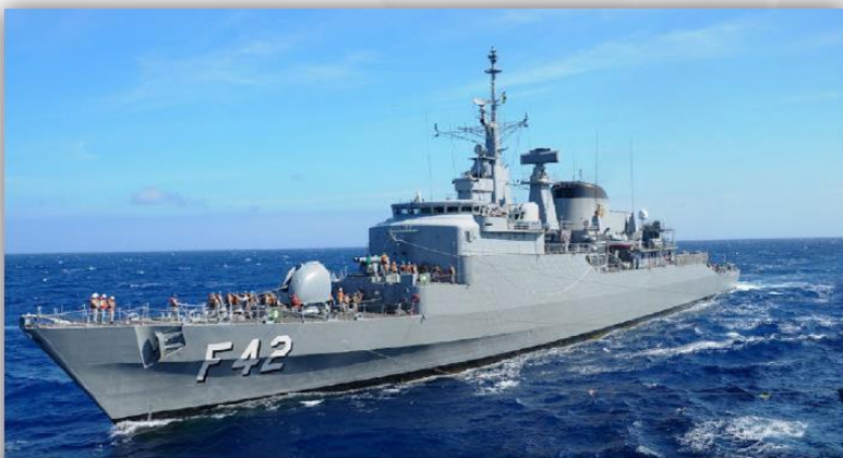
8 Escortas – 39 anos