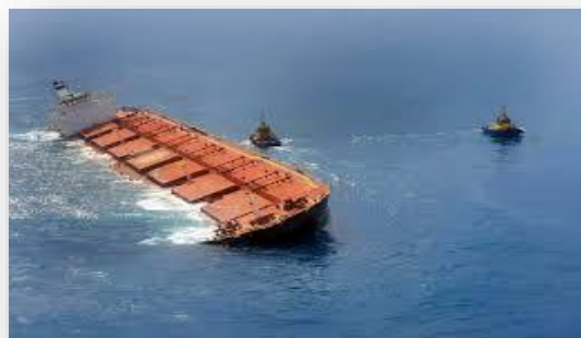
Sinalização Náutica (Balizamento)