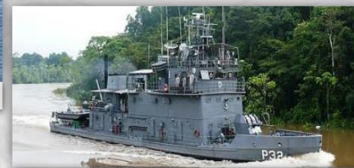
5 NPaFlu – 48 anos