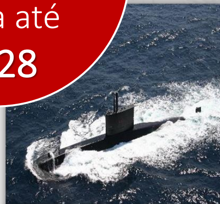
4 Submarinos – 22 anos