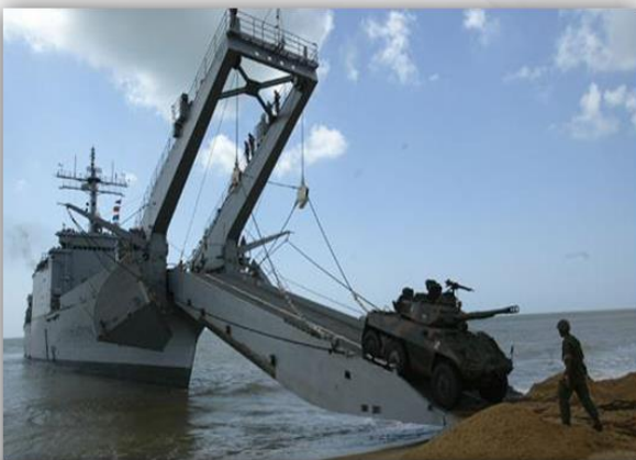
3 Apoio – 41 anos