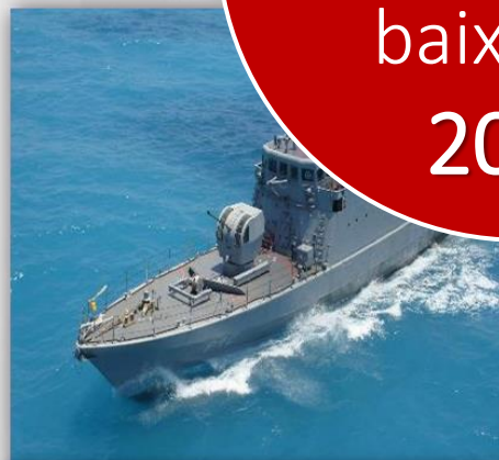
24 NPa – 32 anos