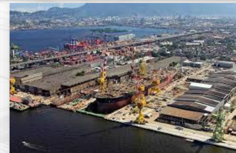
Estaleiros Nacionais (Br do Mar)