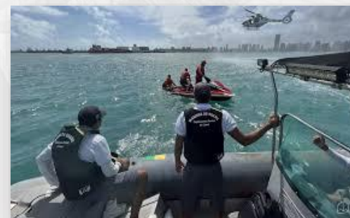
Fiscalização Aquaviária (Operação Verão)