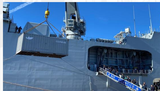
Apoio Humanitário (Operação Taquari)