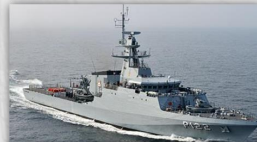
3 NPaOc – 12 anos