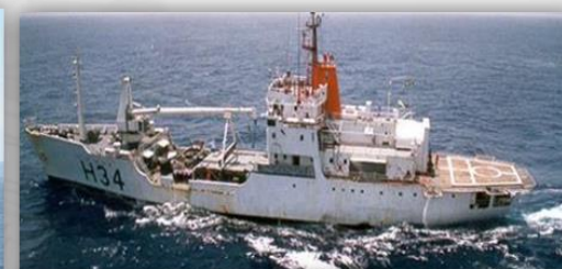
21 Hidrográficos – 29 anos