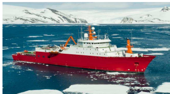
NAVIO POLAR ALMIRANTE SALDANHA