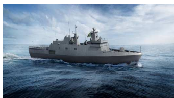
FRAGATAS CLASSE TAMANDARÉ