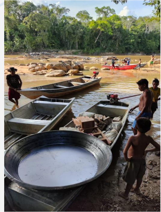
Distribuição de fornos de farinha e "caititu" (ralador de mandioca)