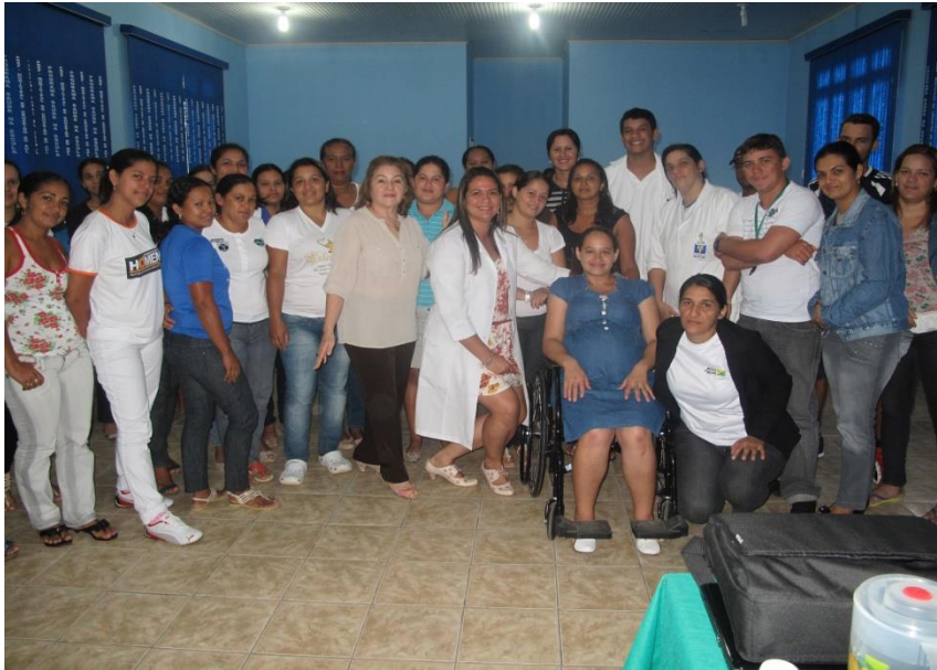
Curso de Cuidadores