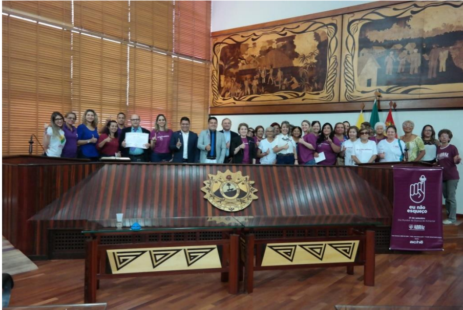
Sessão Solene no Dia Mundial da doença de Alzheimer