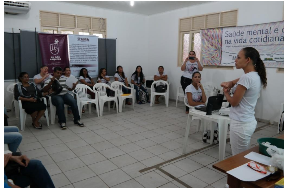
Reunião do Grupo de Apoio