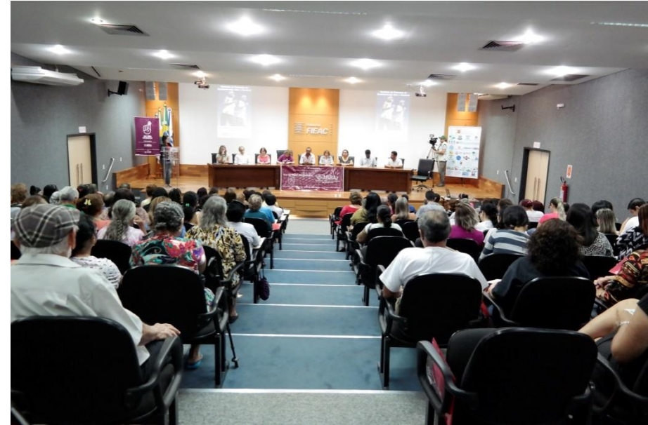
Seminário do Envelhecimento Ativo e Saudável