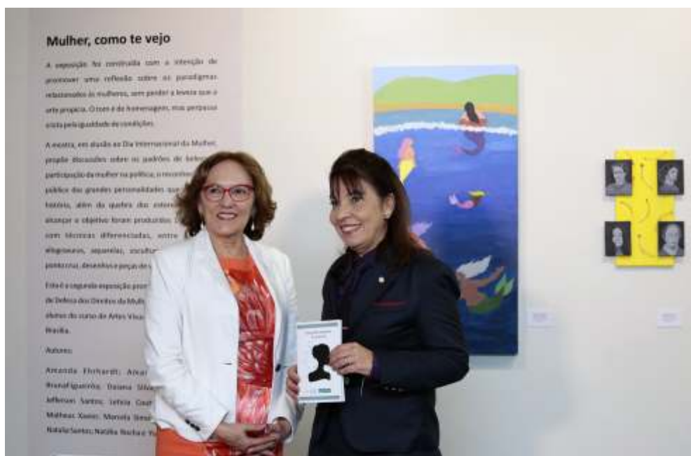
Lançamento da publicação Empoderamento Feminino