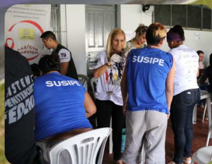
MUTIRÃO DE SAÚDE