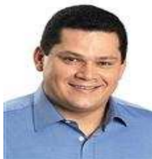
Davi Alcolumbre DEM/AP