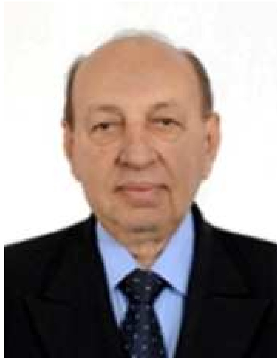
Deputado SIMÃO SESSIM - PP/RJ Presidente