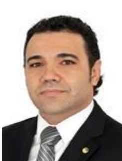
Pr. Marco Feliciano PSC/SP (Gab. 254-IV)