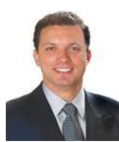
Nelson Marchezan Junior PSDB/RS (Gab. 250-IV)