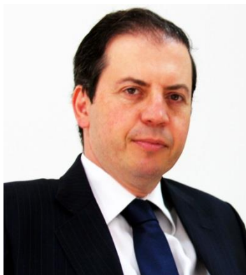
Deputado RODRIGO DE CASTRO - PSDB/MG Presidente