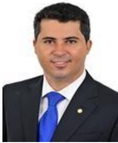
Marcos Rogério PDT/RO (Gab. 930-IV)