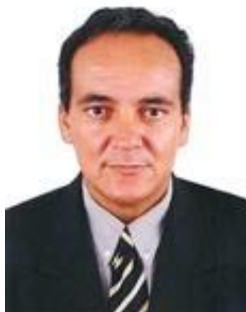
Dep. ÉDIO LOPES PMDB/RR 2º Vice-Presidente