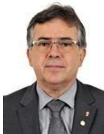
Dep. JOAQUIM PASSARINHO PSB/PA 3º Vice-Presidente