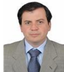
Rodrigo de Castro