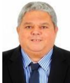
Macedo PSL/CE (Gab. 214-IV)