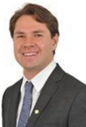
Dep. PEDRO VILELA PSDB/AL 1º Vice-Presidente