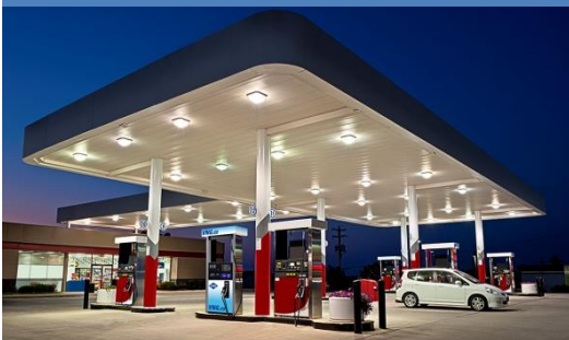
Postos de serviços