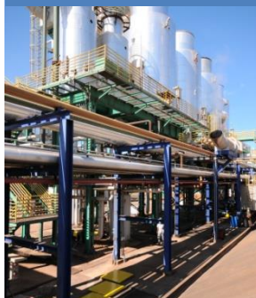
Usinas de etanol