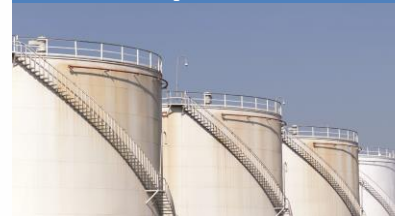
Distribuidoras de combustíveis líquidos