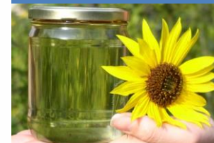
Produtores de biodiesel