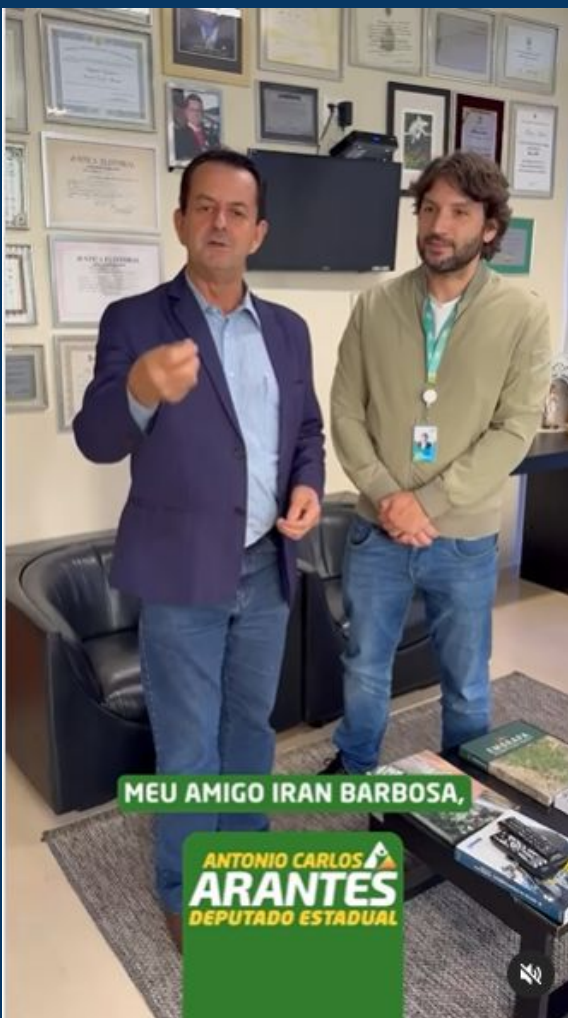
Rede Social do Deputado