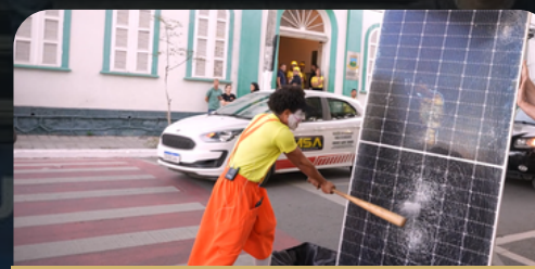
Manifestação pré-audiência Teófilo Otoni - 04/07/2024