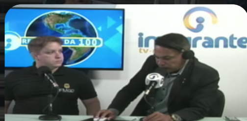
Entrevista Rede Imigrantes 02/07/2024