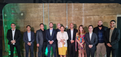
Expo Renováveis Recife-PE 06/03/2024