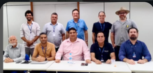
GT - CREA-MG 22/04/2024