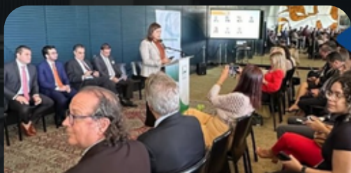
Lançamento da Frente Parlamentar Mista da Energia Limpa GD 29/11/23