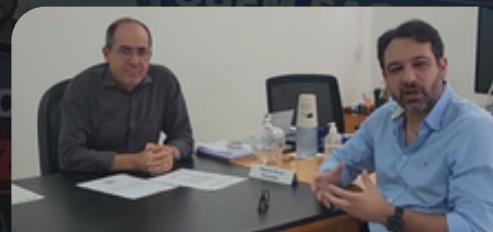
Reunião SEBRAE - MG 24/06/2024