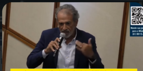
Mesa redonda - Desafios da Micro e Minigeração Distribuída - 30/11/23