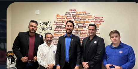
Reunião Dep. Ricardo Campos 05/06/2024