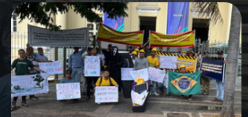
Manifestação G-20 27/05/2024