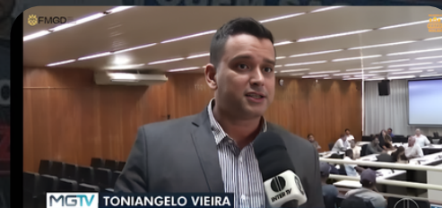
Câmara Governador Valadares MG 09/05/2024