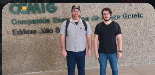
Reunião CEMIG 01/02/2024