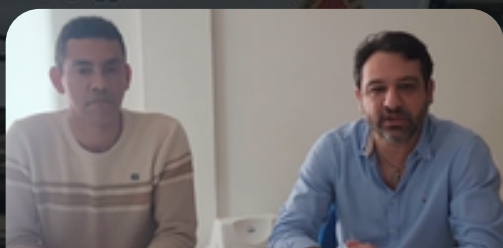
Reunião Comandante Marinho 28/06/2024