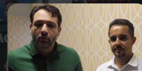
Reunião PROCON-MG 26/06/2024