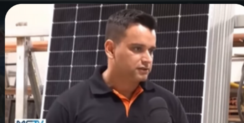
Entrevista a Globo 15/12/23