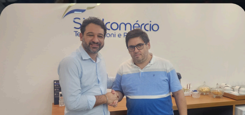
Reunião Sindcomércio 06/05/2024