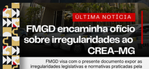
1º Ofício encaminhado ao CREA 09/02/2024