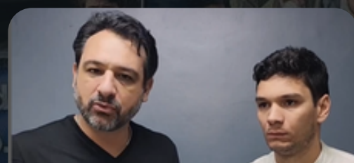
Reunião Vereador Gabriel Gusmão 24/06/2024