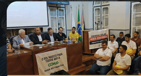
Audiência Pública Teófilo Otoni 04/07/2024