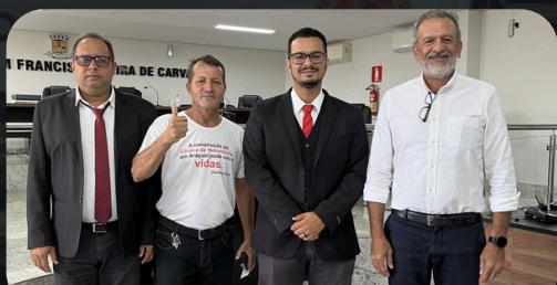
Fórum Invest Vale do Jequitinhonha 08/04/2024