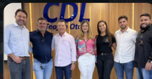
Encontro Empresarial CDL 18/04/2024