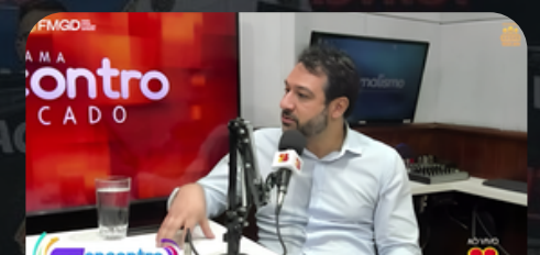
Entrevista Encontro Mercado 14/05/2024