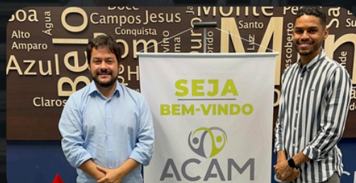
Reunião ACAM 09/04/2024