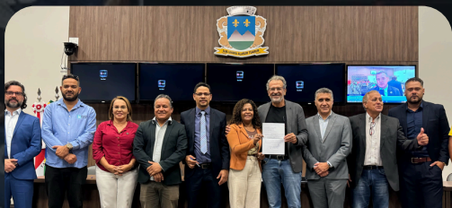
Audiência Pública Montes Claros 17/06/2024