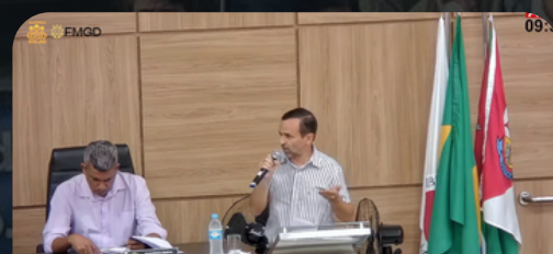
Câmara Vespasiano MG 07/05/2024