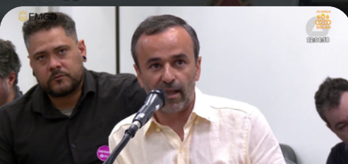
Comissão Minas e Energia 15/05/2024