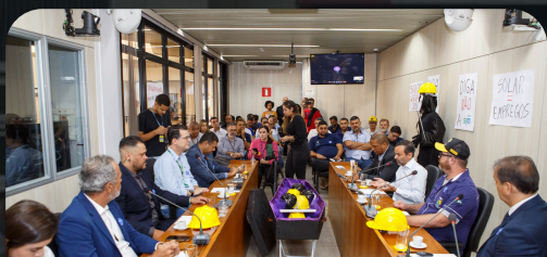
Audiência Pública Belo Horizonte 28/05/2024

ASSEMBLEIA LEGISLATIVA DO ESTADO DE MINAS GERAIS