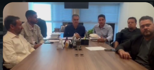
Reunião Dep. Lafayette de Andrada e Gabriel Gusmão 03/06/2024