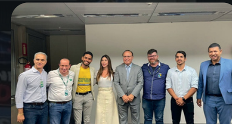
Reunião CEMIG 18/12/23