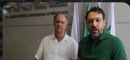
Reunião ACE 20/05/2024