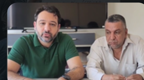
Reunião IENAM 19/04/2024