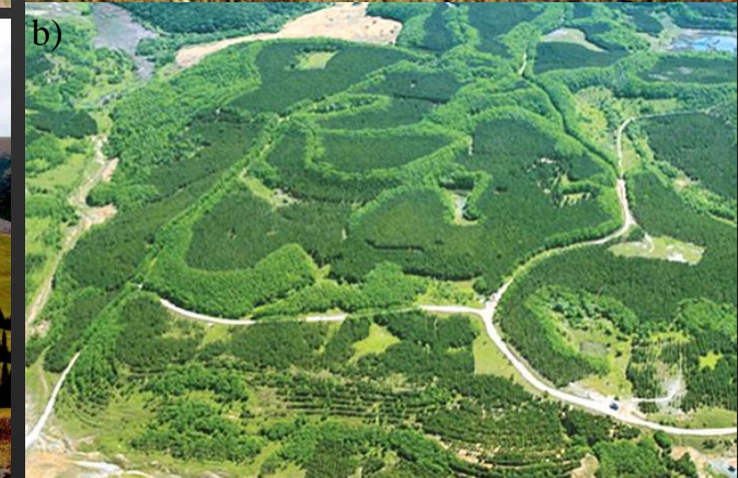
Recuperação de minas abandonadas na forma de arborização. Exemplos de vários países.