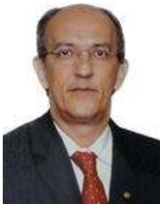
Dep. Arnaldo Jordy PPS/PA