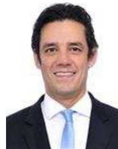
3º Vice-Presidente Deputado Daniel Coelho PSDB/PE