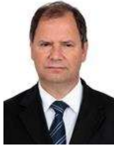
Dep. Alceu Moreira PMDB/RS