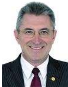
Dep. Heitor Schuch PSB/RS