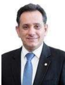
Dep. Nilton Leitão PSDB/MT