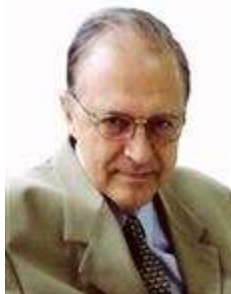
Dep. Antônio Carlos Mendes Thame PV/SP