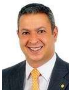
Dep. Ricardo Izar PP/SP