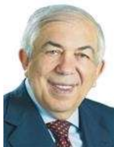
Dep. Paes Landim PTB/PI