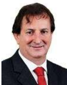
Dep. Nilto Tatto PT/SP