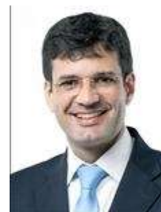
Dep. Marcelo Álvaro Antônio PR/MG