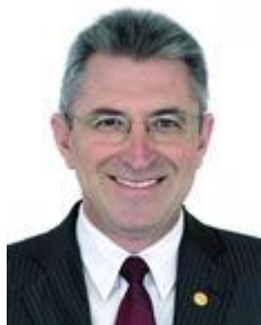
1º Vice-Presidente Deputado Heitor Shuch PSB/RS