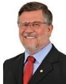
Dep. Assis do Couto PDT/PR