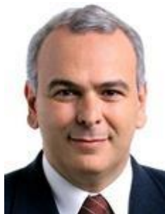
Dep. Júlio Delgado PSB/MG