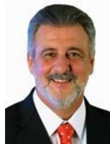
Dep. Carlos Melles DEM/MG