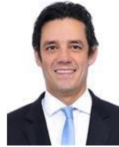
Dep. Daniel Coelho PSDB/PE