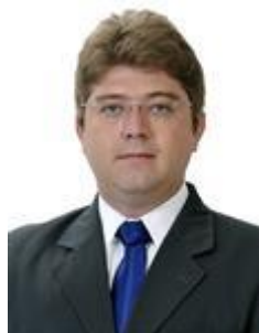
Dep. Rodrigo Martins PSB/PI