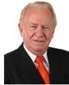
Dep. Josué Bengtson PTB/PA