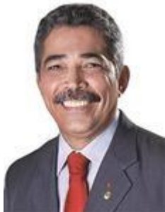
Dep. Leonardo Monteiro PT/MG