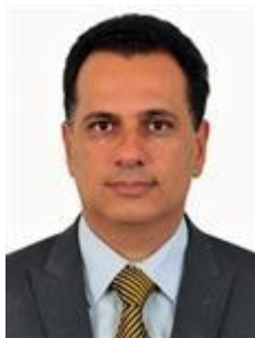
Dep. Max Filho PSDB/ES