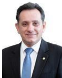
Dep. Nilson Leitão PSDB/MT