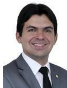
Dep. Victor Mendes PSD/MA