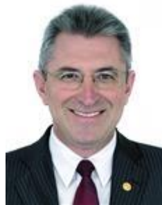
Dep. Heitor Shuch PSB/RS