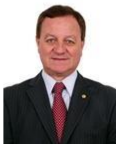
Dep. Valdir Colatto PMDB/SC