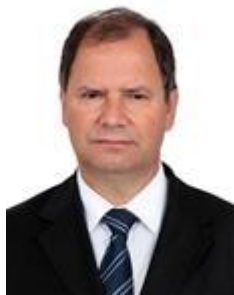
Dep. Alceu Moreira PMDB/RS