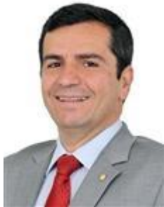
Dep. Givaldo Vieira PT/ES