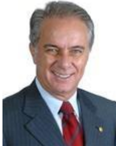
Dep. Marcos Montes PSD/MG