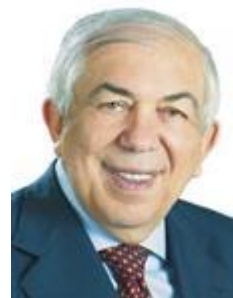
Dep. Paes Landim PTB/PI