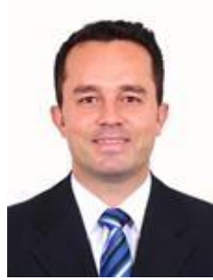
Dep. Stefano Aguiar PSB/MG