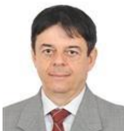
Dep. Toninho Pinheiro (PP-MG)