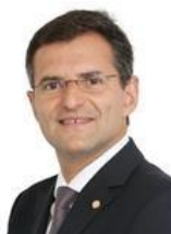
Dep. Marcos Abrão (PPS-GO)