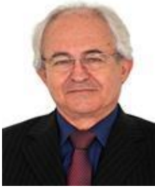
Dep. Adilton Sachetti PSB/MT