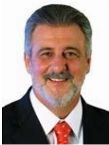
Dep. Carlos Melles DEM/MG