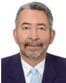
Dep. Paulão PT/AL