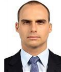
Dep. Eduardo Bolsonaro PSC/SP