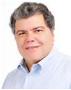
Dep. Sarney Filho PV/MA