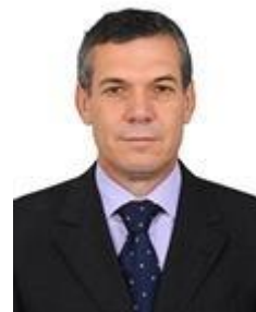
Dep. Zé Silva SD/MG