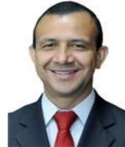
Dep. Carlos Gomes PRB/RS