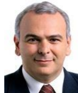
Dep. Júlio Delgado PSB/MG