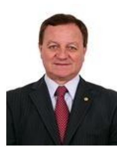
Dep. Valdir Colatto PMDB/SC