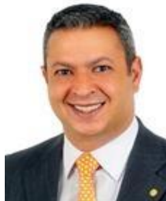
Dep. Ricardo Izar PSD/SP