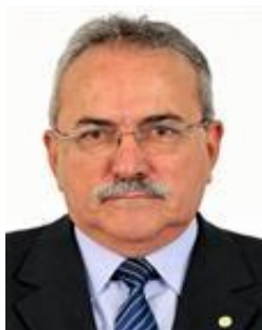
Presidente Deputado Átila Lira PSB/PI