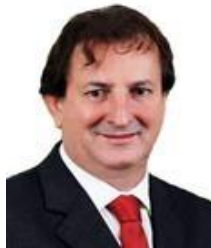
Dep. Nilto Tatto PT/SP