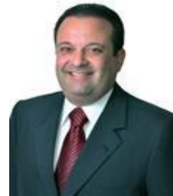
Dep. Andre moura PSC/SE