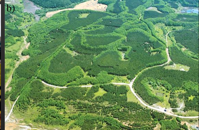
Recuperação de minas abandonadas na forma de arborização. Exemplos de vários países.