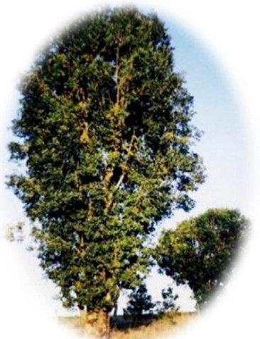
Cultivar Cambona 4