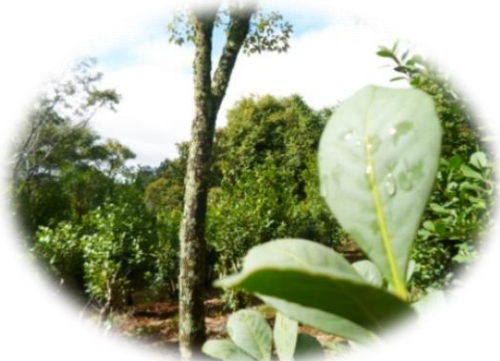
SAF – (QP)