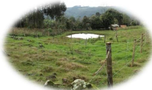
Proteção aos recursos naturais