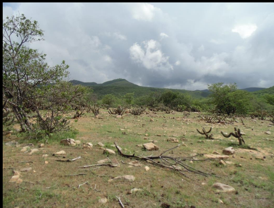
Fotografias: Bernardo Guimarães, 2015.