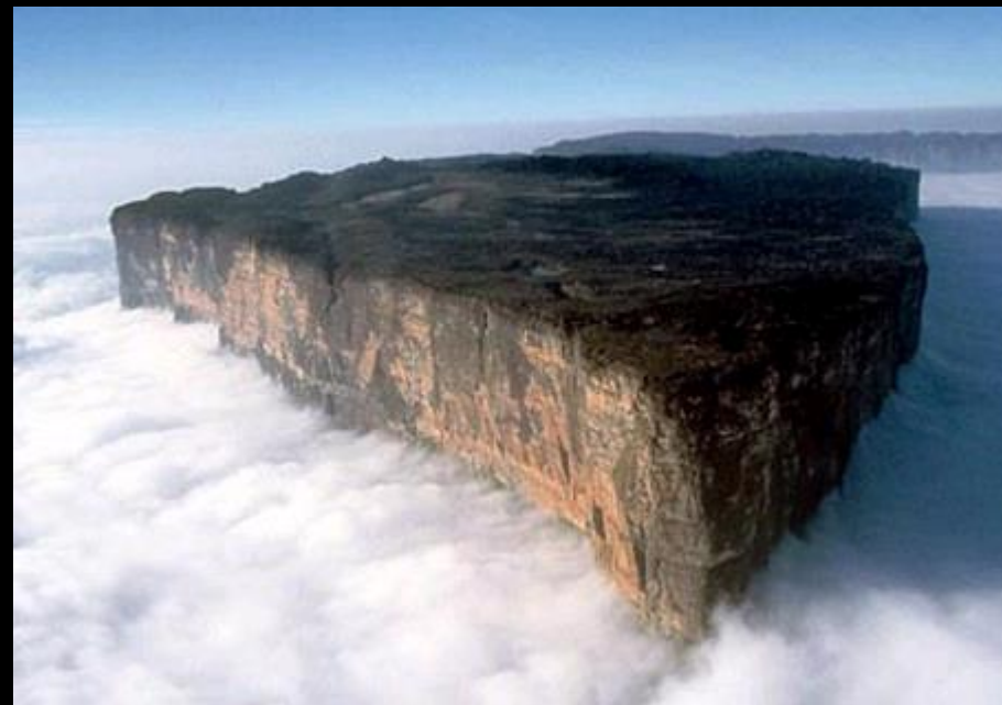
Parna Monte Roraima