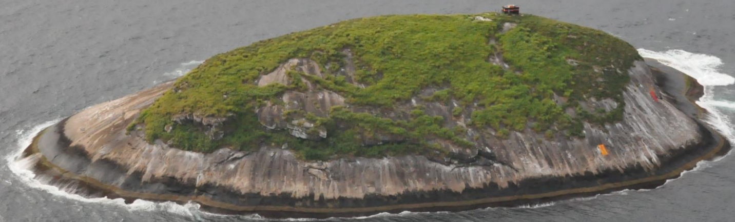
ILHA DA SAPATA