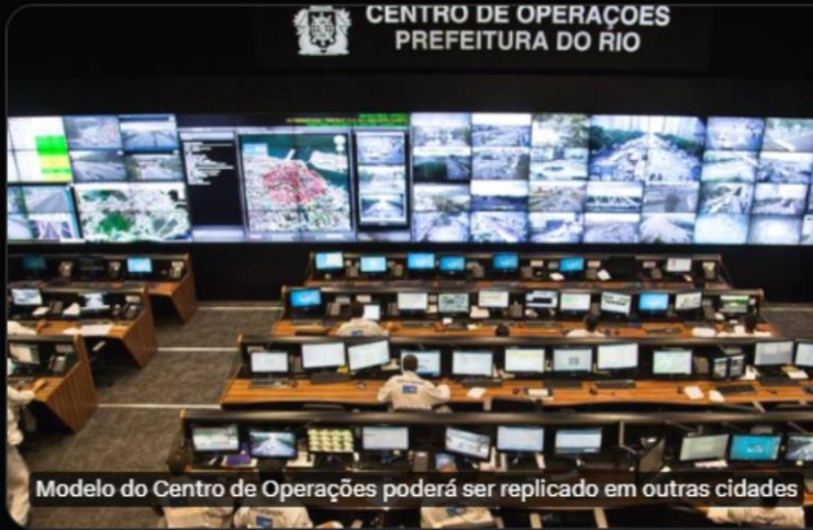
CENTRO DE OPERAÇÕES PREFEITURA DO RIO

ABNT lança protocolo que orienta interessadas em implantar COR; BNDES libera R$ 117 milhões para prefeitura do Rio investir em ações de resposta a desastres