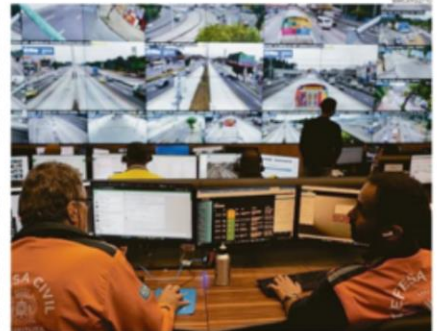
Salão de situação. O ambiente com 25 telas de 55 polegadas permite controlar simultaneamente com agentes de 30 idiomas

servirá para o desenvolvimento de um chamado "gêmeo digital" do Rio. Na prática, o programa funcionaria como um "gêmeo", em que, na cidade virtual, a inteligência artificial ajudará a testar medidas, sem a necessidade de que um imprevisto venha acontecer no mundo real. Do montante, R$ 5 milhões serão investidos em uma rede de servidores inteligentes: monitoramento de sensores, o equipamento trata mais informações para o COR e poderia, eventualmente, abrir sinais antes do tempo programado, a partir da percepção do trânsito. Inaugurado em dezembro de 2010, depois que um temporal castigou a cidade, o Centro de Operações Rio monitora condições climáticas e busca minimizar outras ocorrências de impacto na cidade, como deslizamentos