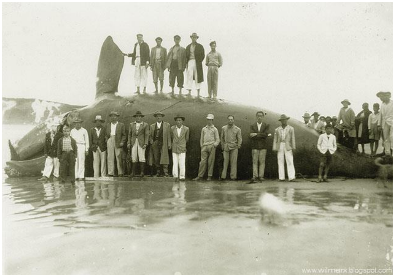
Imbituba/SC – Década de 1950