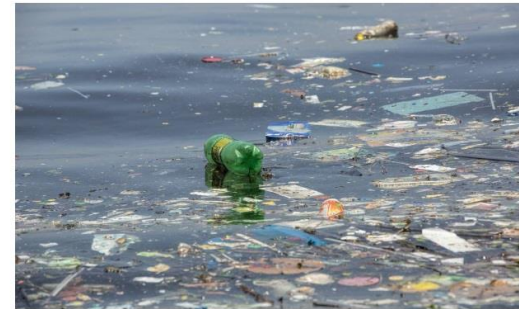
Lixo plástico na Baía de Guanabara: detritos chegam ao litoral através de córregos, falhas no sistema de drenagem e descarte inadequado do setor industrial.