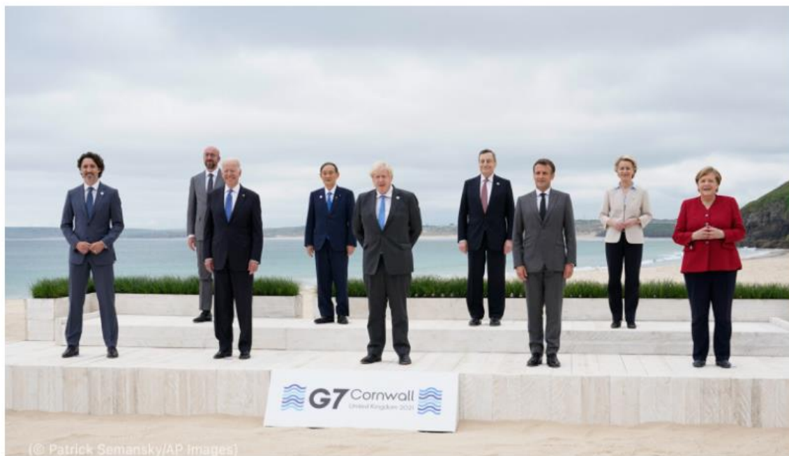
Os líderes do G7 em 11 de junho em uma praia na Bala de Carbis, Inglaterra. Líderes a partir da esquerda: o primeiro-ministro canadense, Justin Trudeau; o presidente do Conselho Europeu, Charles Michel; o presidente dos EUA, Joe Biden; o primeiro-ministro japonês, Yoshihide Suga; o primeiro-ministro britânico, Boris Johnson; o primeiro-ministro italiano, Mario Draghi; o presidente francês, Emmanuel Macron; a presidente da Comissão Europeia, Ursula von der Leyen; e a chanceler alemã, Angela Merkel

Líderes do G7 se comprometem a combater as mudanças climáticas