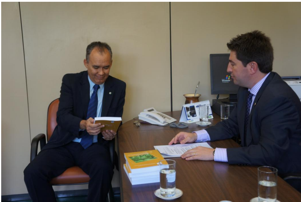
Ministro Francisco Teixeira e Deputado Jerônimo Goergen

Fruto da colaboração de diversos parceiros: Confederação da Agricultura e Pecuária do Brasil (CNA); Confederação Nacional do Comércio de Bens, Serviços e Turismo (CNC); Confederação Nacional da Indústria (CNI); Ministro da Integração Nacional; Tribunal de Contas da União (TCU) e Consultores Legislativos da Casa, o livro apresenta diversos artigos, com diferentes pontos de vista, sobre o progresso para as regiões brasileiras.