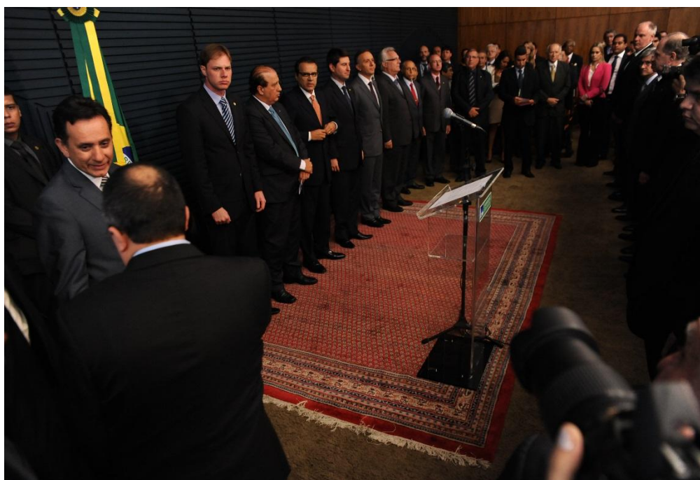
Foto panorâmica do evento

Local: Câmara dos Deputados - Salão Nobre