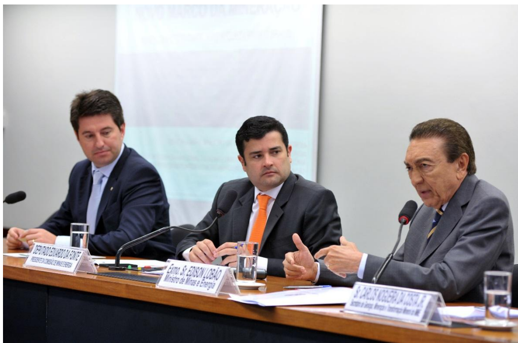
Mesa: Deputado Jerônimo Goergen, Deputado Eduardo da Fonte e Ministro Edison Lobão