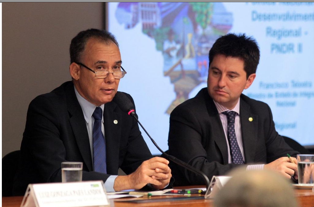
Mesa: Deputado Jerônimo Goergen e Ministro Francisco Teixeira