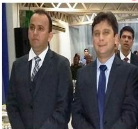
PREFEITO- JONES VICE- ARTUR BRITO