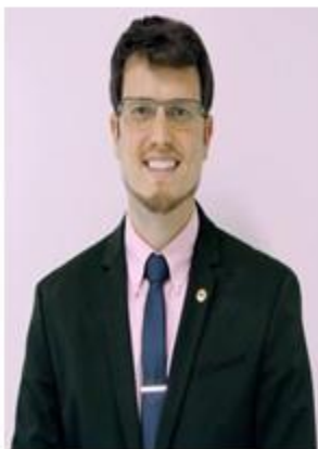
DEP ESTADUAL DIRCEU TEM CATEN