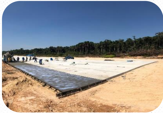
Estirão do Equador/AM