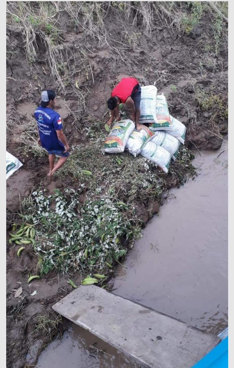
Carregamento de castanha no Rio Madeira