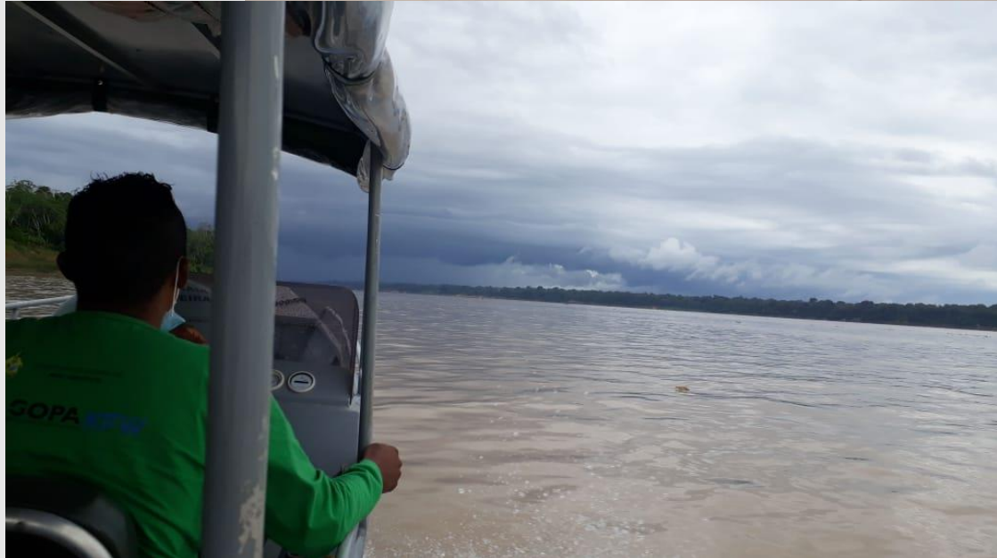
Deslocamento entre Novo Aripuanã/AM e Borba/AM