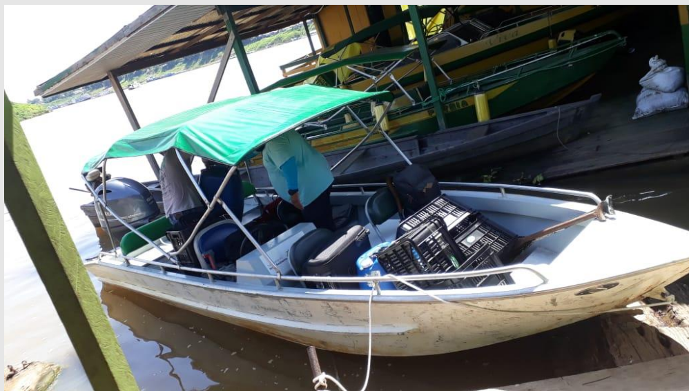
Lancha utilizada no deslocamento pelo rio Purus