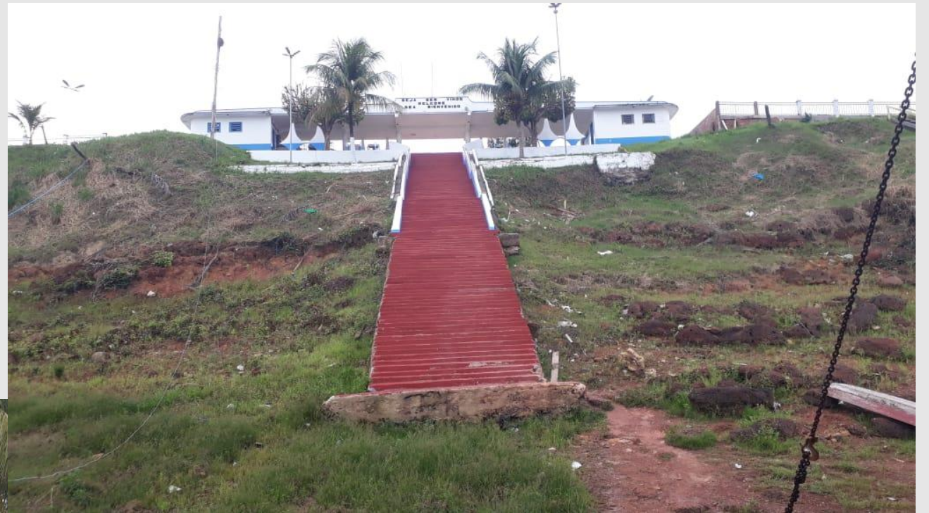
Saída de Novo Aripuanã/AM para Manicoré/AM