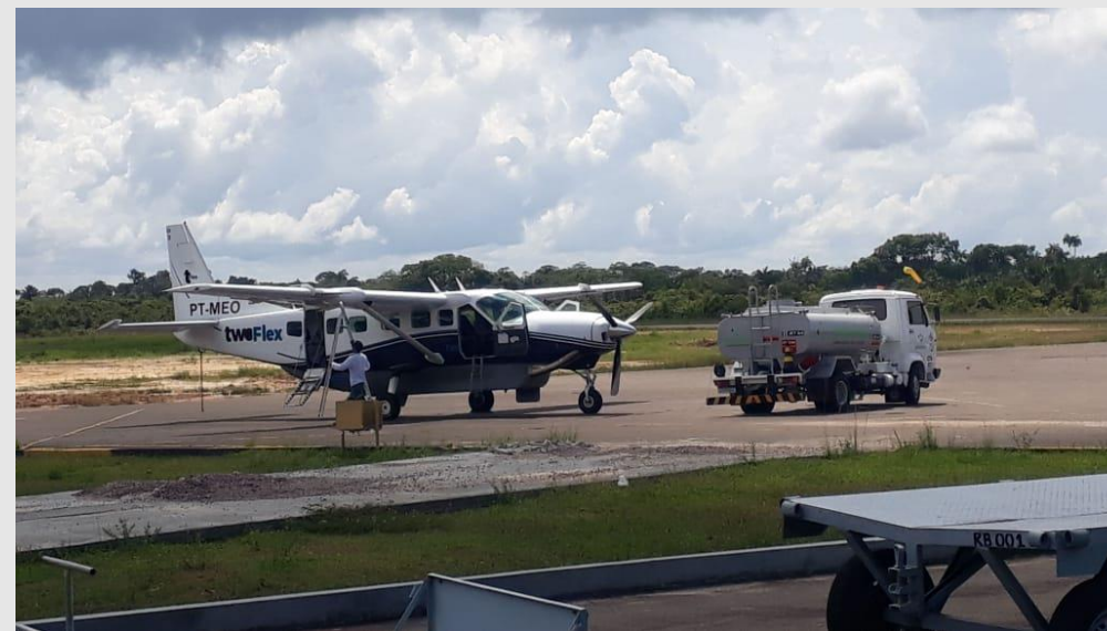
Escala em Coari/AM