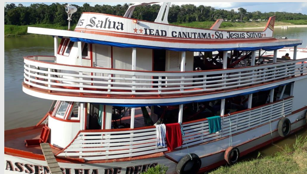
Embarcação utilizada no deslocamento pelo rio Purus