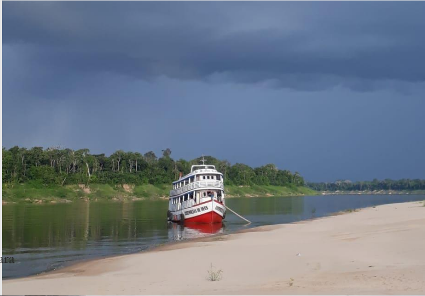
Tabuleiro Santa Bárbara