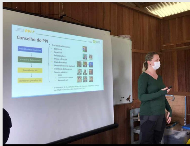
Reunião do Conselho Gestor da Floresta Estadual Canutama

Resex Canutama Floresta Estadual Canutama RDS Rio Amapá RDS Rio Madeira RDS Matupiri Parque Estadual Matupiri