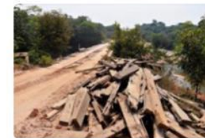
Ponte Rio Amapá - Ramal de Democracia