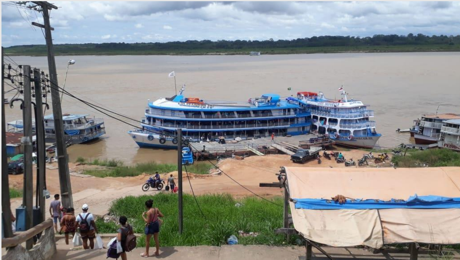
Embarcação comercial atracada em Manicoré/AM