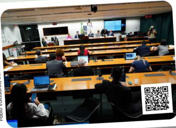
Pablo Valadares/Câmara dos Deputados