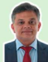
Dimas Gadelha PT/RJ