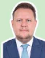
Covatti Filho PP/RS