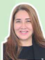
Sonize Barbosa PL/AP