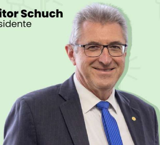
Heitor Schuch Presidente

Agradeço a todos os envolvidos, em especial aos parlamentares, pelo seu comprometimento e dedicação ao longo desse período. Estamos encerrando um capítulo, mas tenho a convicção de que as bases sólidas estabelecidas pavimentarão o caminho para um futuro ainda mais próspero e dinâmico para a indústria, o comércio e os serviços no Brasil. Continuemos a trilhar juntos este caminho de progresso e colaboração em prol da Comissão de Indústria, Comércio e Serviços.