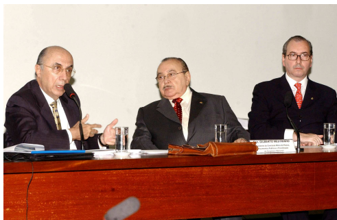
Henrique Meirelles, Sen. Gilberto Mestrinho e Dep. Eduardo Cunha

Participante: Henrique Meirelles, Presidente do Banco Central do Brasil.