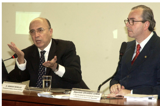
Henrique Meirelles e Dep. Eduardo Cunha

Participante: Henrique Meirelles, Presidente do Banco Central do Brasil.