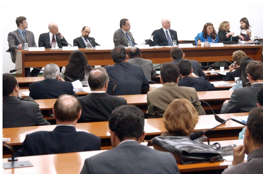
Sindicalistas e Dep. Henrique Eduardo Alves