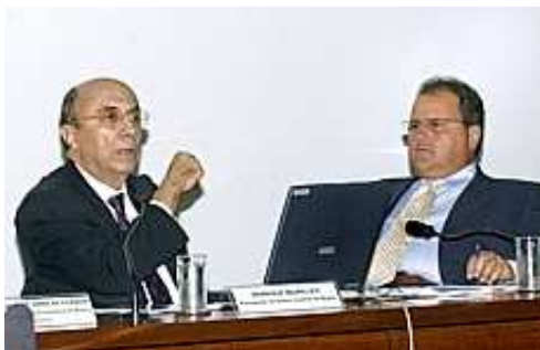
Henrique Meirelles e Dep. Geddel Vieira Lima

Participante: Henrique Meirelles, Presidente do Banco Central do Brasil.