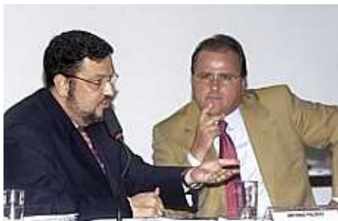
Ministro Antonio Palocci e Dep. Geddel Vieira Lima

Participante: Antonio Palocci, Ministro da Fazenda.