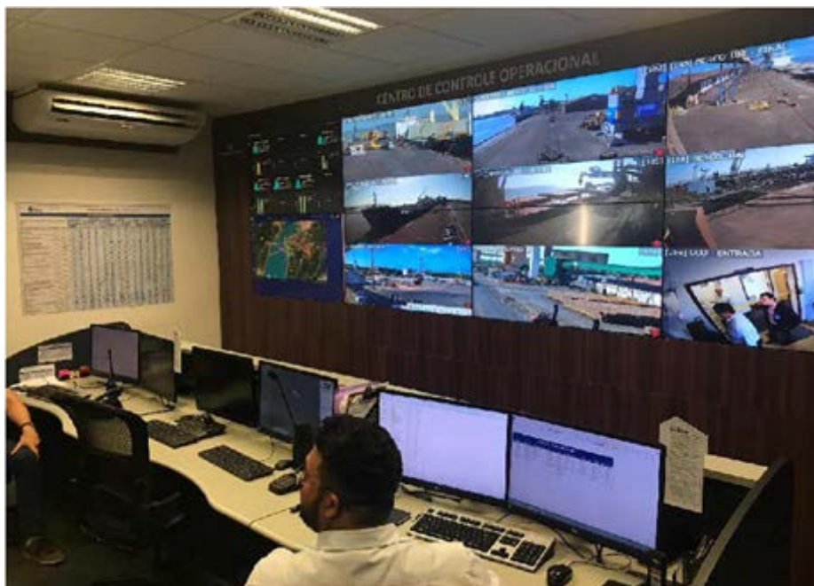
Central de controle operacional do Porto de Itaqui