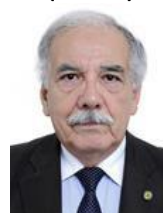
Dr. Luiz Ovando (PSL-MS)