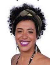
Talíria Petrone (PSOL-RJ)