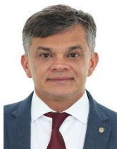
Dimas Gadelha (PT-RJ)