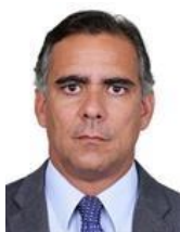
Leur Lomanto Júnior (UNIÃO-BA)