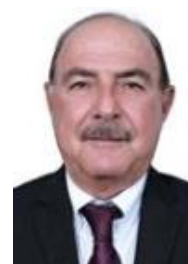
Dr. Zacharias Calil (União-GO)