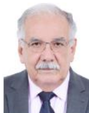
Dr. Luiz Ovando (PP-MS)