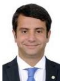
Dr. Luizinho (PP-RJ)