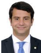
Doutor Luizinho (PP-RJ)