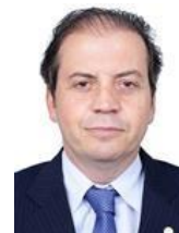
Rodrigo de Castro (UNIÃO-MG)