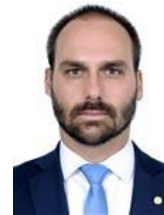
Eduardo Bolsonaro (PL-SP)