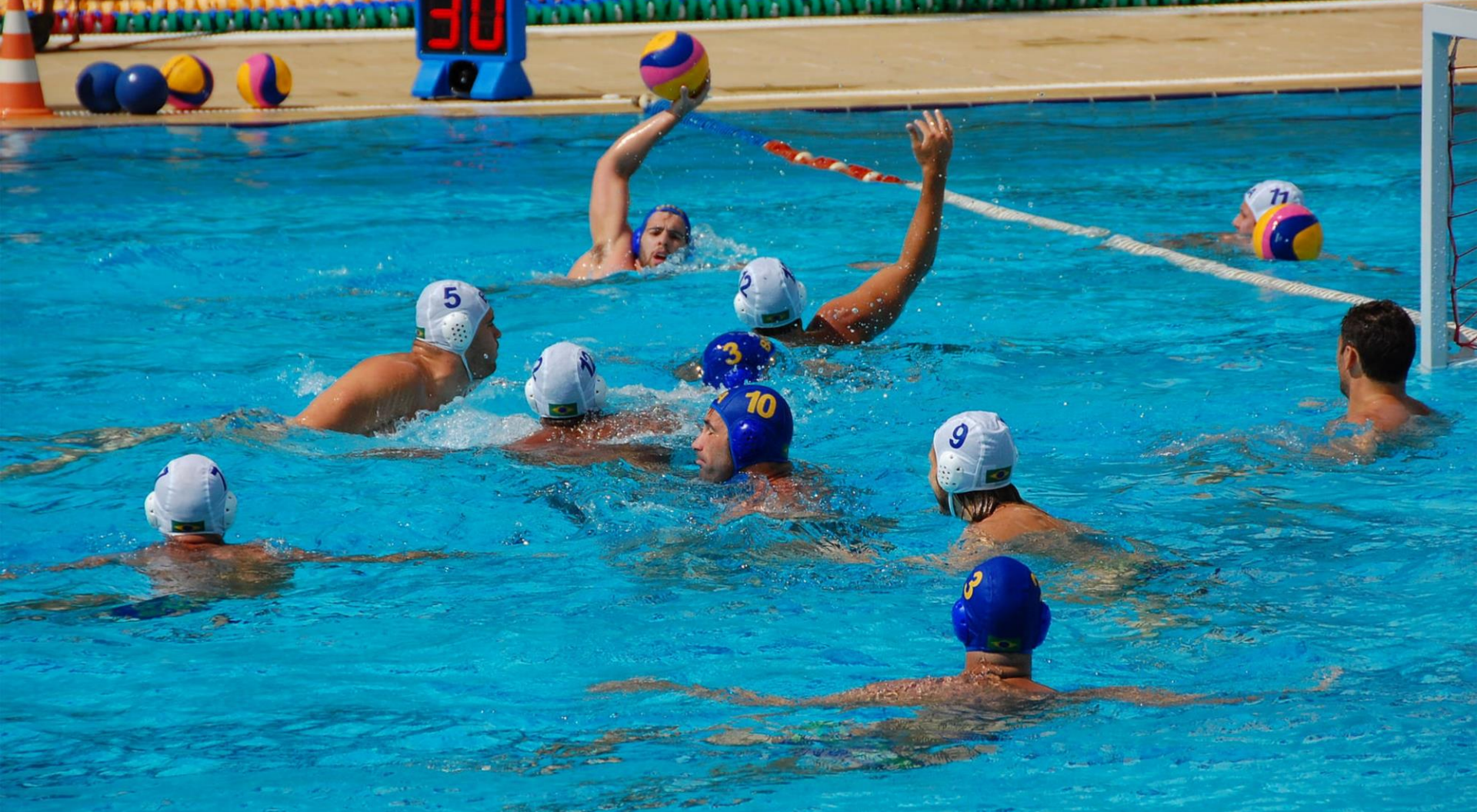
Treino Seleção Brasileira de Polo Aquático