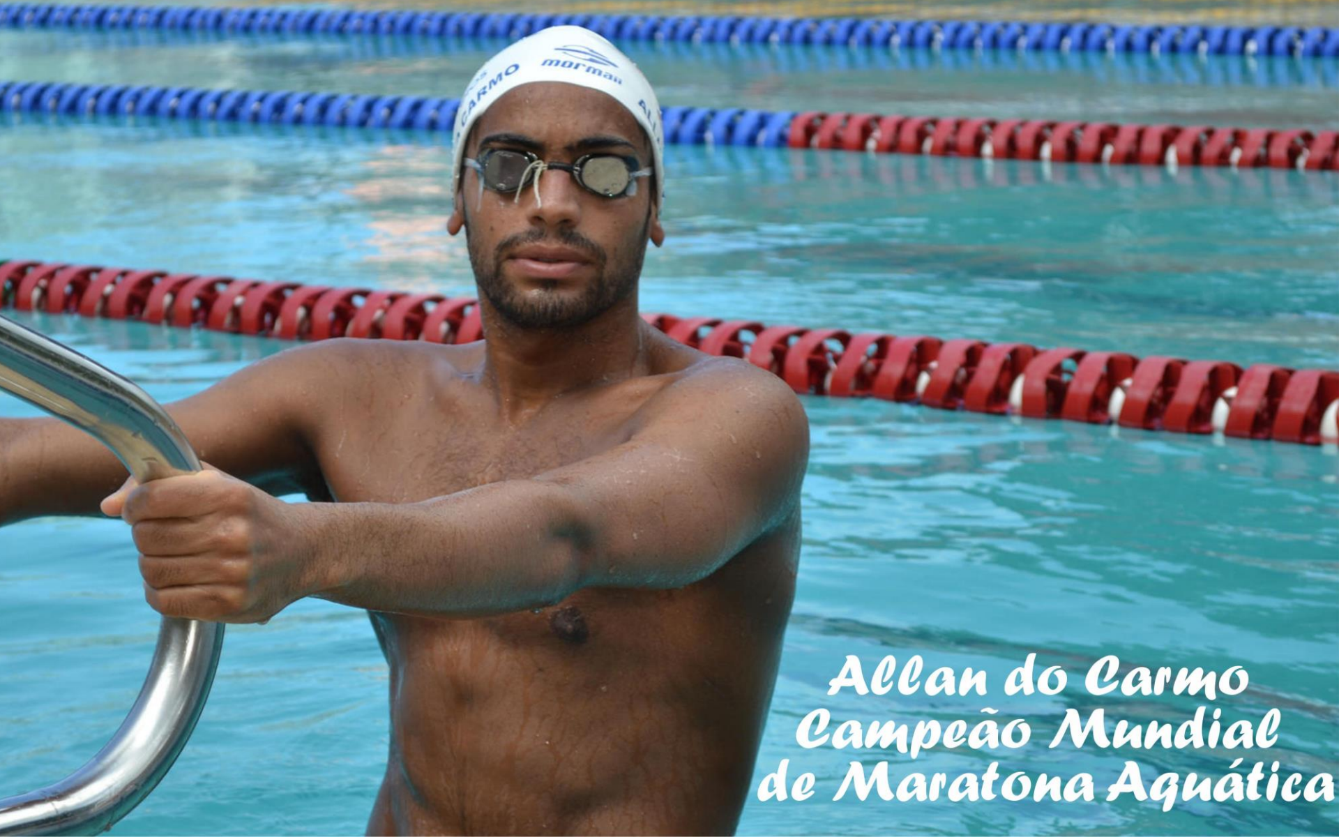
Allan do Carmo Campeão Mundial de Maratona Aquática