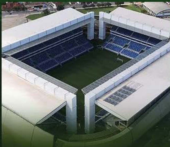
ARENA PANTANAL 43 mil pessoas