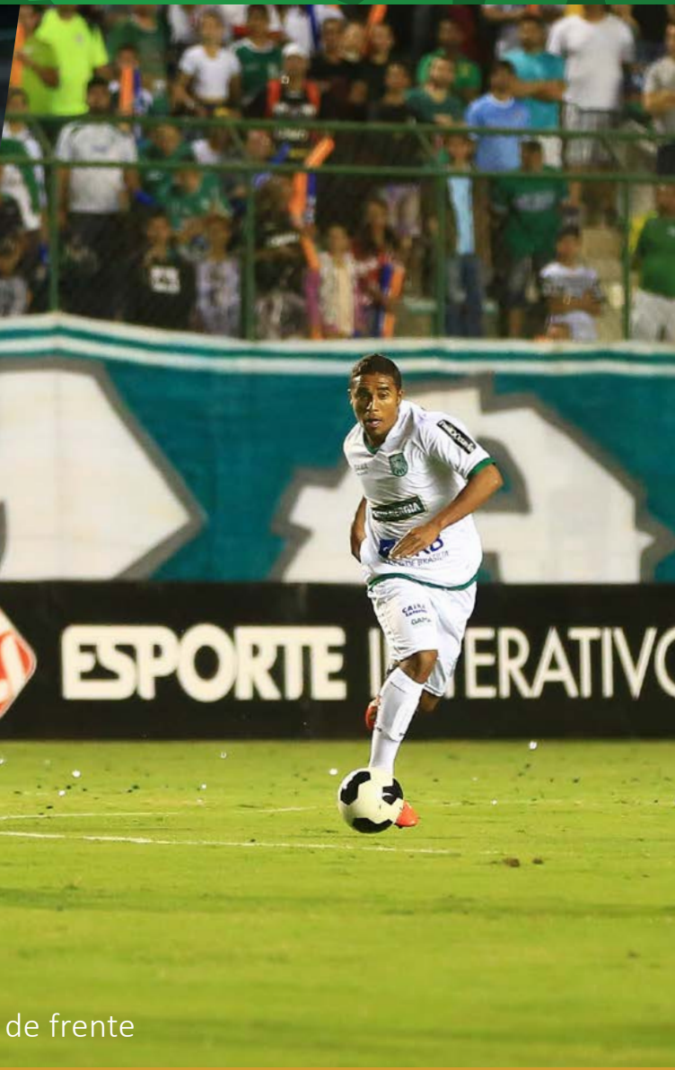
linha de frente