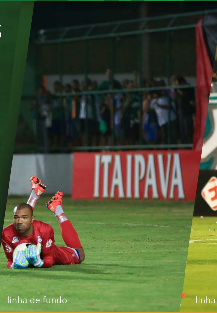
linha de fundo