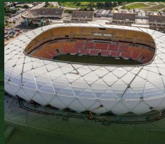
ARENA DA AMAZÔNIA 42 mil pessoas