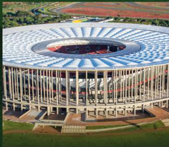
MANÉ GARRINCHA 73 mil pessoas