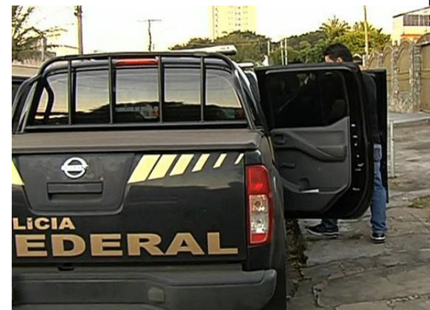
Polícia Federal cumpre mandados em Goiânia nesta quarta-feira

Do G1 GO, com informações da TV Anhangüera