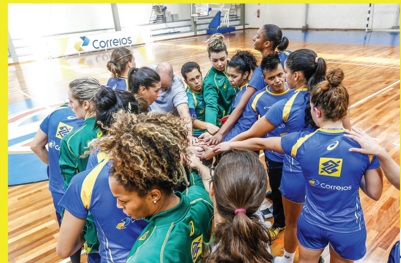
São Caetano do Sul (SP)