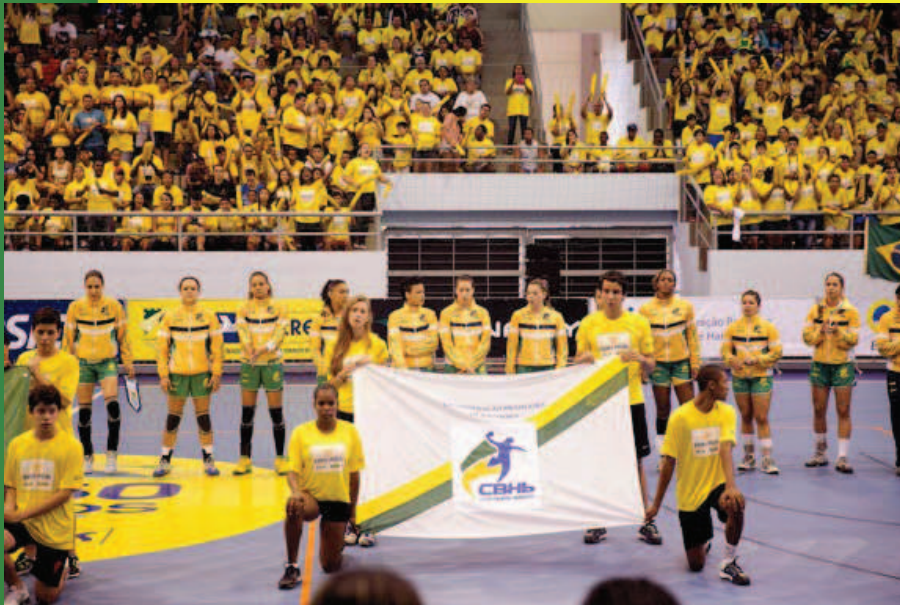
Cabo Frio (RJ)