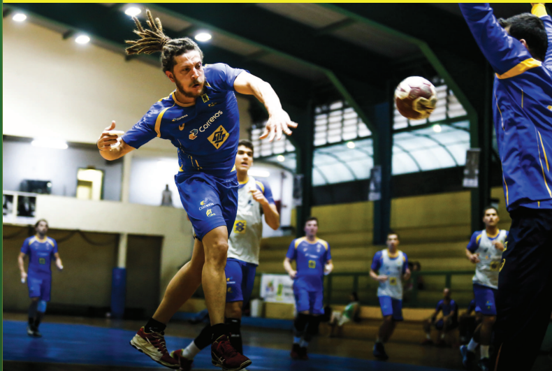
Santo André (SP)