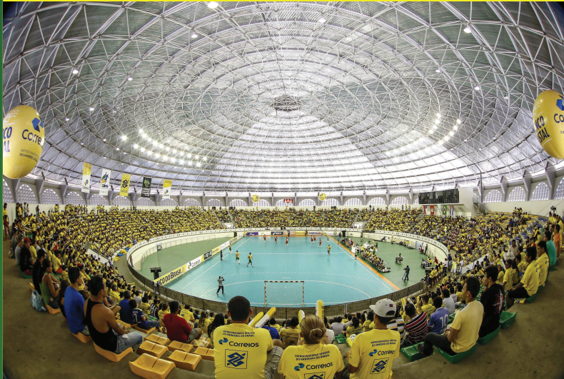
João Pessoa (PB)