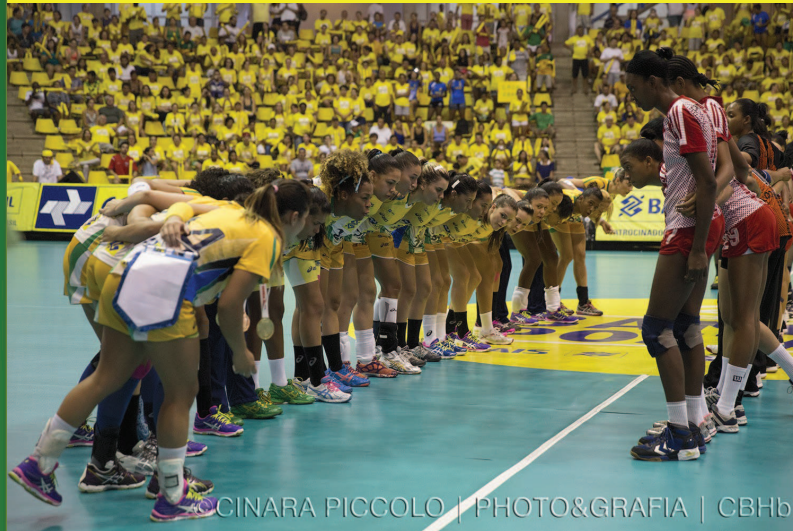
São Bernardo do Campo (SP)