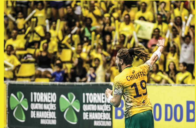
São Bernardo do Campo (SP)