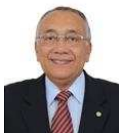
GASTÃO VIEIRA (PROS-MA)