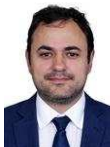
GLAUBER BRAGA (PSOL-RJ)