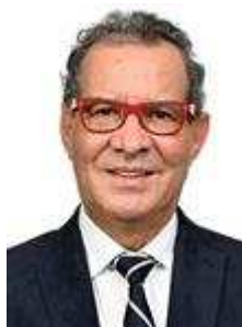
HAROLDO CATHEDRAL (PSD-RR)