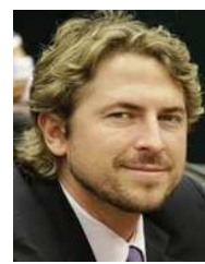
ZECA DIRCEU (PT-PR)