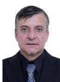
BOCA ABERTA (PROS-PR)