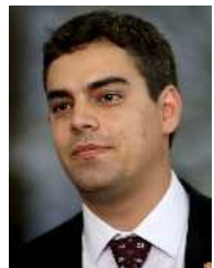
TIAGO MITRAUD (NOVO-MG)