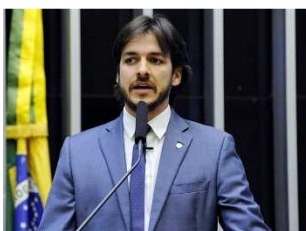
Presidente: Pedro Cunha Lima (PSDB/PB)