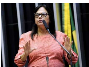
2ª Vice-Presidente: Alice Portugal (PCdoB/BA)