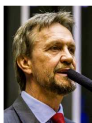
PEDRO UCZAI (PT-SC)