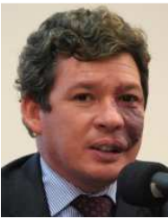
REGINALDO LOPES (PT-MG)