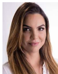
PAULA BELMONTE (CIDADANIA-DF)