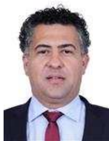
ALENCAR SANTANA BRAGA (PT-SP)