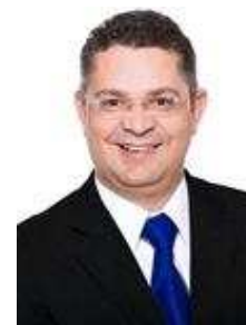
SÓSTENES CAVALCANTE (DEM/RJ)