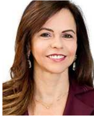
PROFESSORA DORINHA SEABRA REZENDE (DEM-TO)