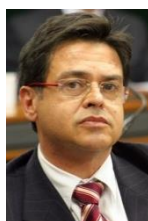
EDUARDO BARBOSA (PSDB-MG)