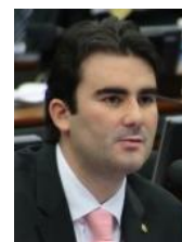
CAIO NARCIO (PSDB-MG)