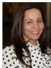
PROFESSORA MARCIVANIA (PCdoB-AP)