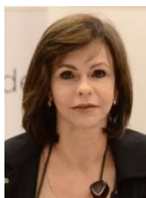
PROFESSORA DORINHA SEABRA REZENDE (DEM-TO)