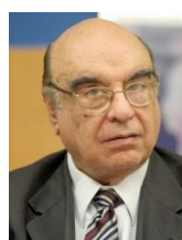
BONIFÁCIO DE ANDRADA (DEM-MG)