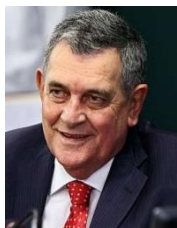
ARNALDO FARIA DE SÁ (PP-SP)