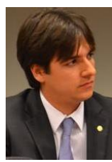
PEDRO CUNHA LIMA (PSDB-PB)