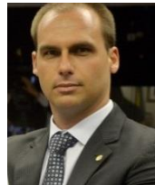
EDUARDO BOLSONARO (PSL-SP)