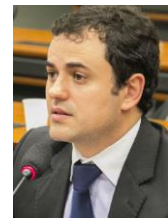
GLAUBER BRAGA (PSOL-RJ)