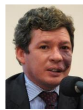
REGINALDO LOPES (PT-MG)