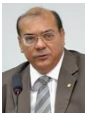
NILSON PINTO (PSDB-PA)