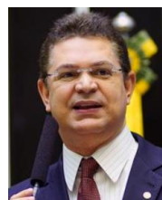
SÓSTENES CAVALCANTE (DEM-RJ)