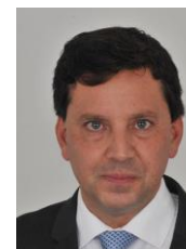
FLORIANO PESARO (PSDB-SP)