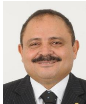
WALDIR MARANHÃO (PSDB-MA)