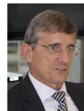
DARCÍSIO PERONDI (MDB-RS)