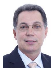
EZEQUIEL FONSECA (PP-MT)