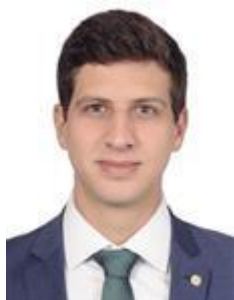
JOÃO H. CAMPOS (PSB-PE)