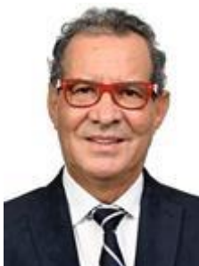
HAROLDO CATHEDRAL (PSD-RR)