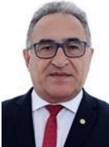
EDMILSON RODRIGUES (PSOL-PA)