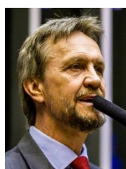
PEDRO UCZAI (PT-SC)