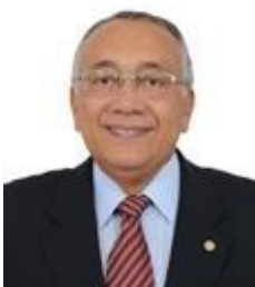
GASTÃO VIEIRA (PROS-MA)