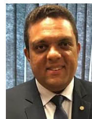
OTONI DE PAULA (PSC-RJ)