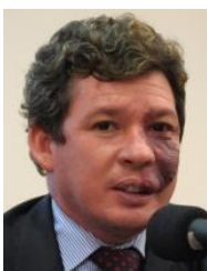
REGINALDO LOPES (PT-MG)