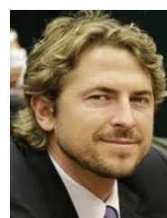
ZECA DIRCEU (PT-PR)