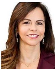
PROFESSORA DORINHA SEABRA REZENDE (DEM-TO)