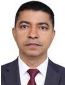
BIRA DO PINDARÉ (PSB-MA)