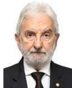
IVAN VALENTE (PSOL-SP)