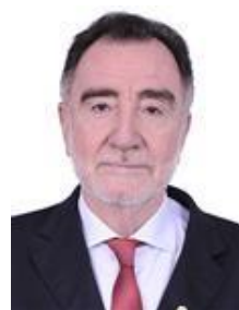
PATRUS ANANIAS (PT/MG)