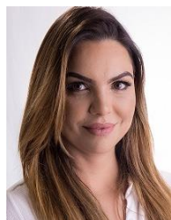
PAULA BELMONTE (CIDADANIA-DF)