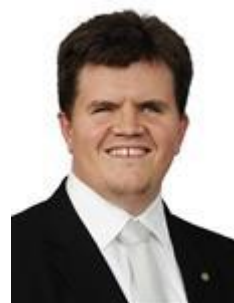
FELIPE RIGONI (PSC-ES)