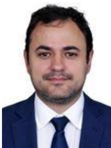
GLAUBER BRAGA (PSOL-RJ)