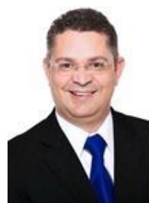
SÓSTENES CAVALCANTE (DEM/RJ)