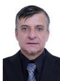
BOCA ABERTA (PROS-PR)