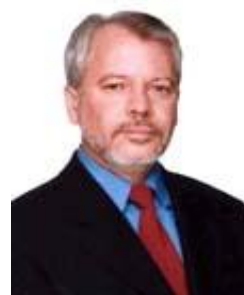
Biffi PT / MS