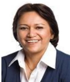
Fátima Bezerra PT / RN