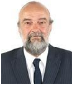
Penna PV / SP