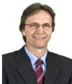
Deputado PEDRO UCZAI PT / SC 1º Vice-Presidente