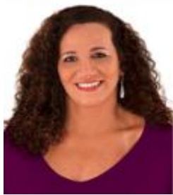
Jandira Feghali PCdoB / RJ