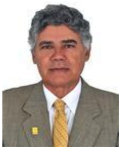
Chico Alencar PSOL / RJ