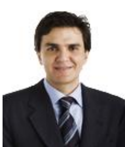
Gabriel Chalita PMDB / SP