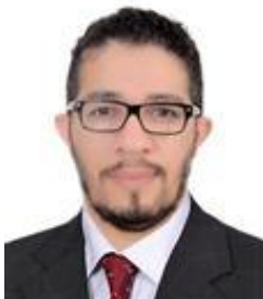
Jean Wyllys PSOL / RJ