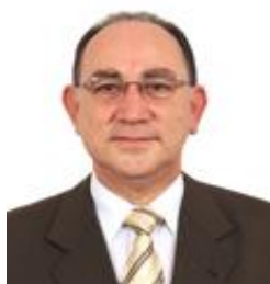
Paulo Freire PR / SP