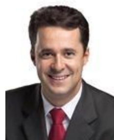
Anderson Ferreira PR / PE