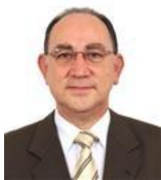
Paulo Freire PR / SP