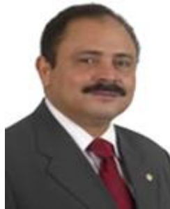
Waldir Maranhão PP / MA