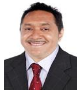
Tiririca PR / SP