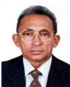
Costa Ferreira PSC / MA