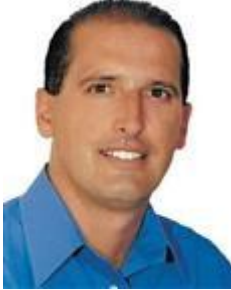
Onyx Lorenzoni DEM / RS