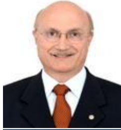
Osmar Serraglio PMDB / PR