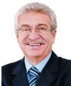
Deputado NEWTON LIMA (PT / SP) Presidente