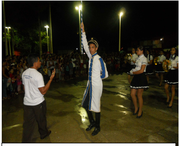
Fig. 4 - Apresentação à comunidade