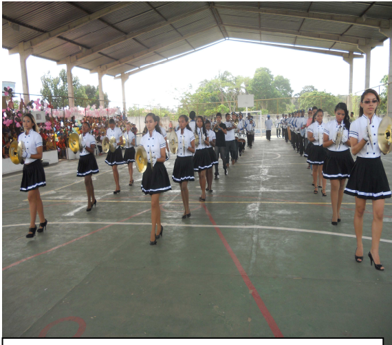
Fig. 3 - Apresentação à