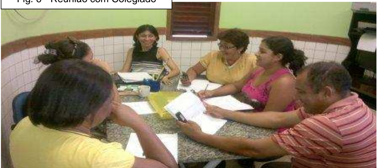
Fig. 6 - Reunião com Colegiado