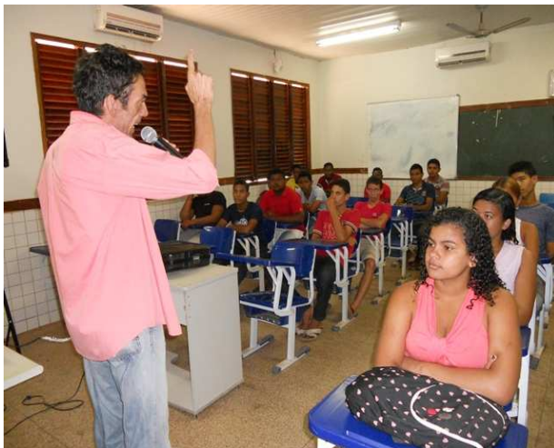
Figura 1 - Palestra motivacional