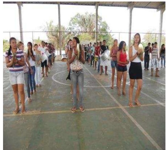
Figura 2 – Ensaios da Banda