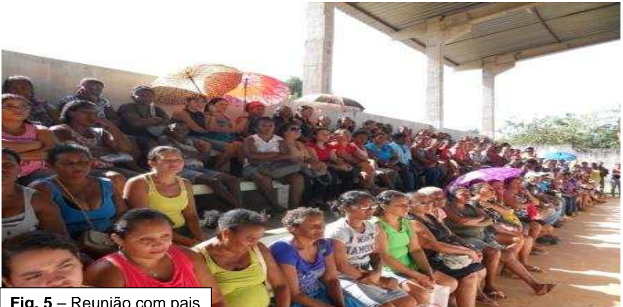
Fig. 5 – Reunião com pais