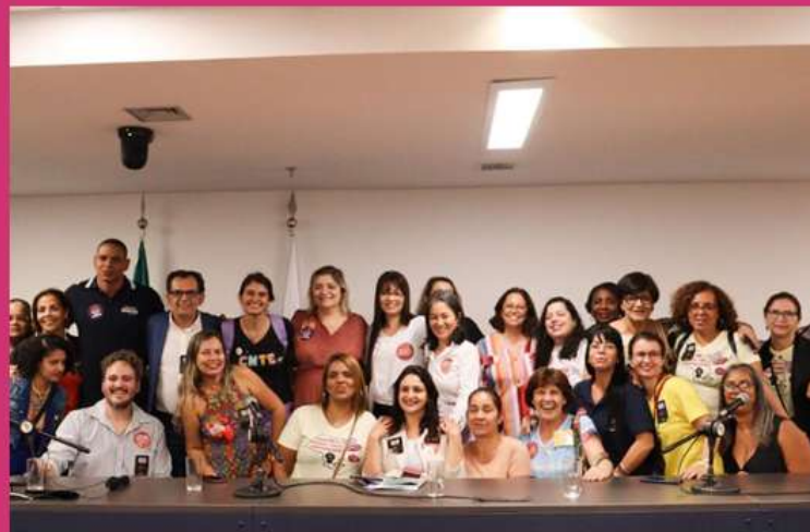
Rio de Janeiro