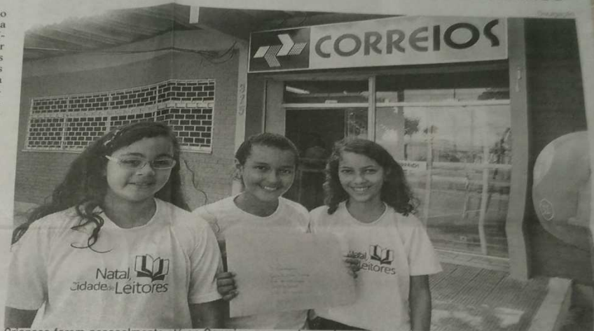
Crianças foram pessoalmente até os Correios para poder enviar a carta endereçada a presidente Dilma Rousseff