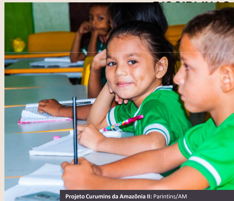
Projeto Curumins da Amazônia II: Parintins/AM

Recomenda-se que as orientações para a progressão abram espaço para uma certa flexibilização, de forma a adequar os conteúdos aos contextos locais.