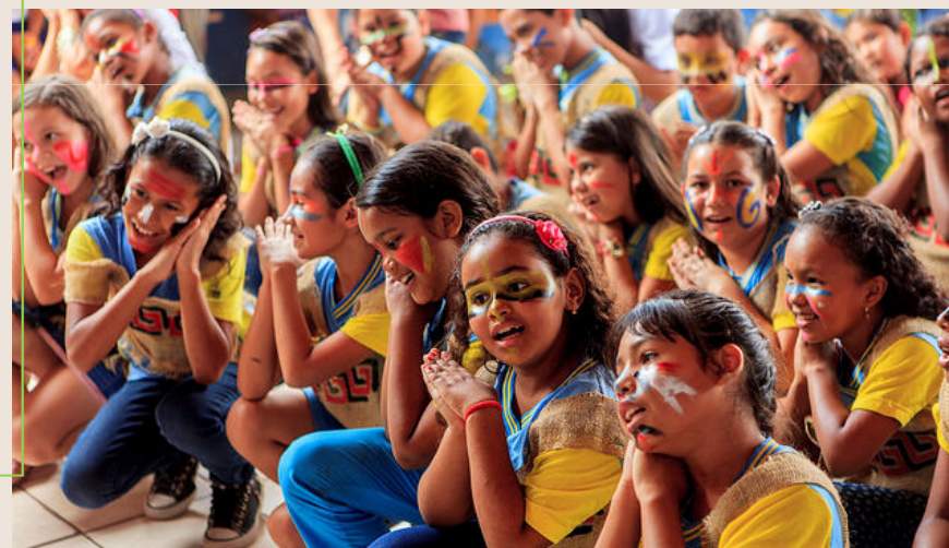
PROJETO TUPIZITINHOS DA ASSOCIAÇÃO CENÁCULO NOSSA SRA. DO PERPÉTUO SOCORRO POR PRÊMIO ITAÚ UNICEF

A BNCC deve incluir como conteúdos e diretrizes (temas integradores) valores democráticos e republicanos de natureza universal relativo ao enfrentamento de todas as formas de discriminação.