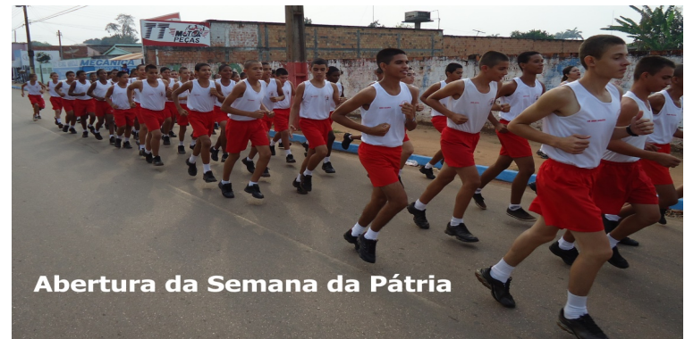
Abertura da Semana da Pátria