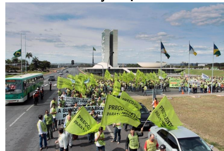
“Preço justo para produzir” Mobilização da ABCS e Filiadas

Julho/2012: Instalação da Frente Parlamentar Mista da Suinocultura, resultado do empenho da Associação Brasileira dos Criadores de Suínos (ABCS) junto aos parlamentares na busca de soluções para a crise.