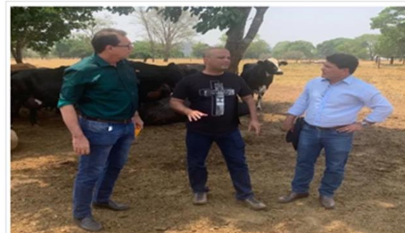
Deputado Major Vitor Hugo (C), com produtores de leite goianos

6 de novembro de 2020 Agricultura, agronegócio, deputado major vitor hugo, governo federal, pecuária leiteira, plano de fortalecimento setor leiteiro, produtores de leite, setor leiteiro