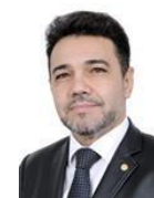
Pr. Marco Feliciano (PODEMOS/SP)