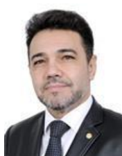
Presidente: Pr. Marco Feliciano (PODEMOS/SP)