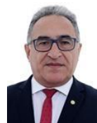
Edmilson Rodrigues (PSOL/PA)