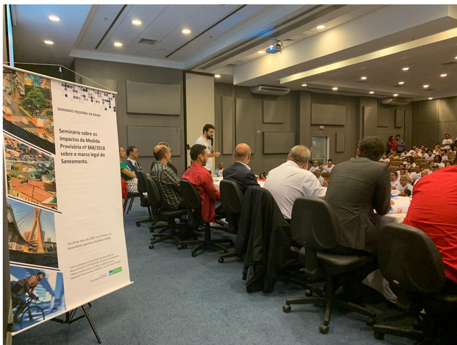
Crédito: Gabinete do Dep. Joséildo Ramos

Tema: Medida Provisória nº 868/2018 que atualiza o marco legal do saneamento básico e altera a Lei nº 9.984/2018